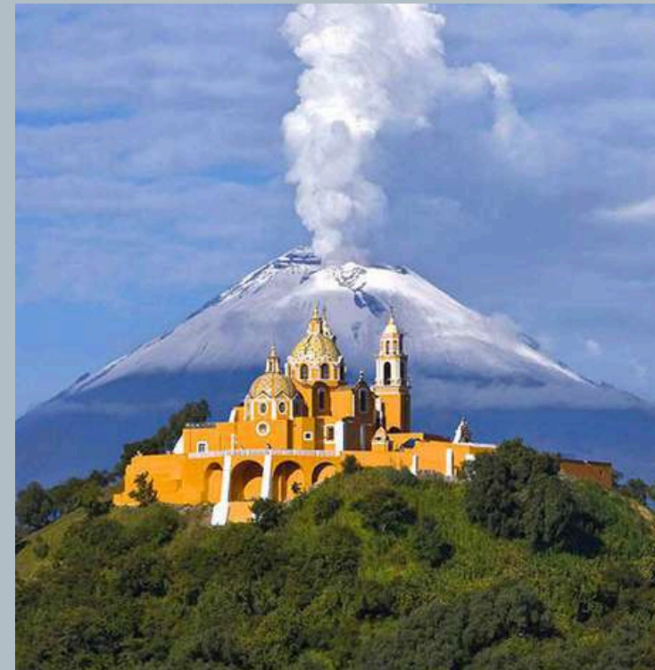
CHOLULA A 15 minutos