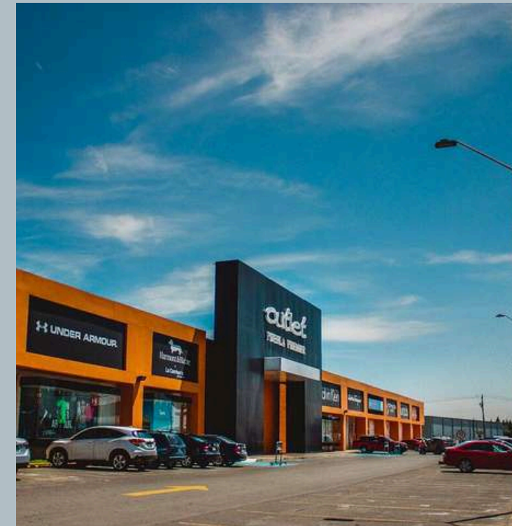
OUTLET PUEBLA A 5 minutos