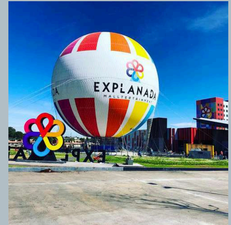
EXPLANADA PUEBLA A 15 minutos