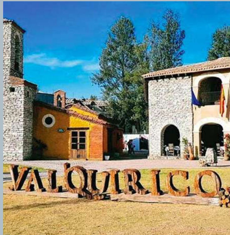
VAL'QUIRICO A 15 minutos

El municipio de Cuautlancingo se encuentra dentro de las zonas más prósperas de Puebla, destacando por su ubicación estratégica y rápido crecimiento.